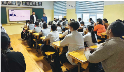
Арвайхээрийн 1-р сургуулийн ангийг тохижуулав.