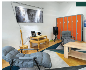
Хужирт сумын Ерөнхий боловсролын сургуулийн багш нарын амралтын өрөөг бүрэн засварлаж, амрах ая тухтай орчинг бүрдүүлэв.