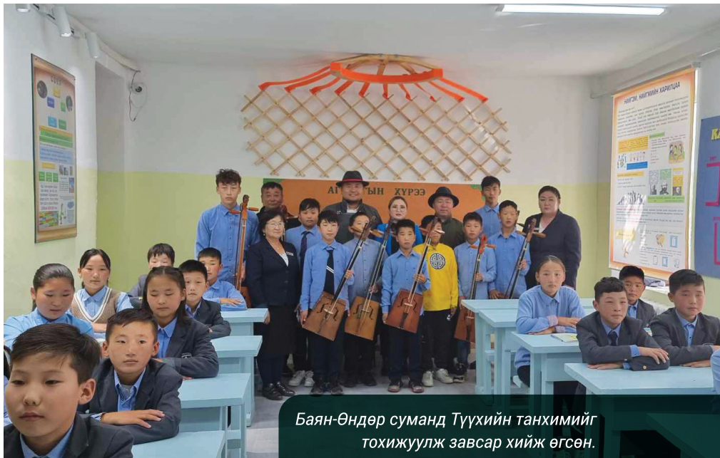
Баян-Өндөр суманд Түүхийн танхимийг тохижуулж завсар хийж өгсөн.