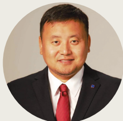
ХУУЛИЙГ БОЛОВСРУУЛСАН: Хуульч О.Алтангэрэл