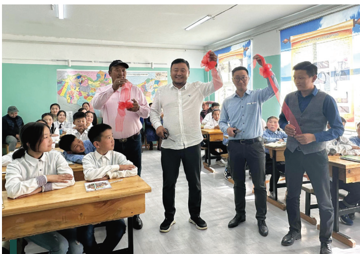
Өвөрхангай аймгийн Сант суманд түүх нийгмийн ухааны танхимд засвар хийж тохижуулж өгсөн.