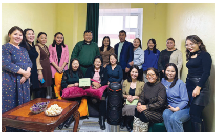
Хархорин сумын багш нарын амралтын өрөөг тохижуулж өгөв