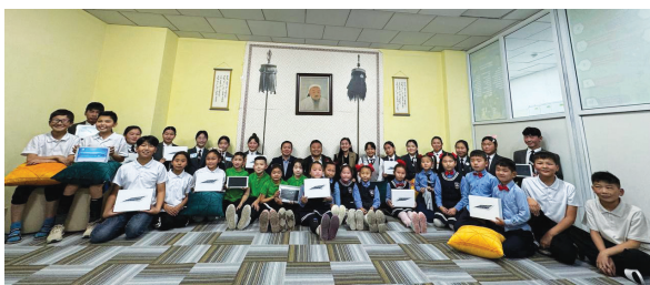
Арвайхээрийн 5-р сургуулийн хүүхдүүдэд цахим номын сан тохижуулж өгөв.