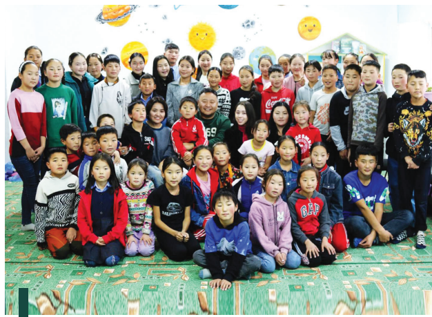
Зүүнбаян-Улаан сумын ЕБС-ийн дотуур байрны хүүхдүүдийг амрах, өөрийгөө хөгжүүлэх өрөөг иж бүрэн тохижуулж өгсөн.